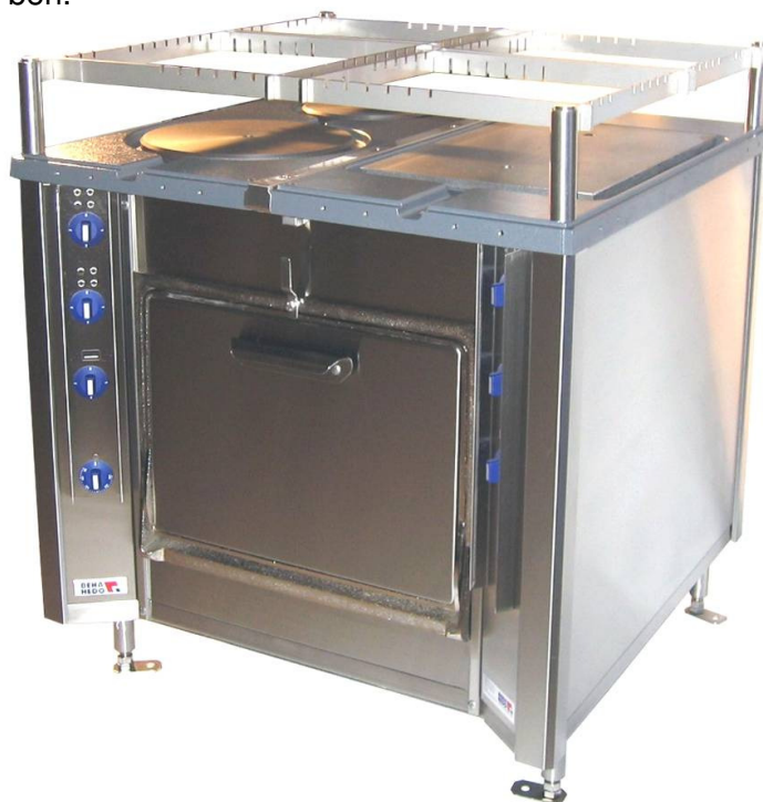
Avbildet kombinasjon 31 AB

Alle plater (topper) har 3-trinns regulering.